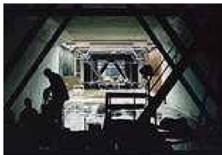
De bouw van de Schipholtunnel

De hypothese die ik aan het begin van dit hoofdstuk gaf klopt niet helemaal. Ik dacht dat elk bouwbedrijf de aanbesteding kreeg die het beste bij dat bedrijf paste. Dit klopt niet, omdat de bedrijven onderling bij elkaar zijn gaan zitten en de prijzen met elkaar hebben vergeleken. Het bedrijf dat de laagste prijs vroeg kreeg de opdracht. Maar d.m.v. corrupte ambtenaren kon de prijs van het goedkoopste bedrijf opgevoerd worden tot net onder de prijs die de overheid er maximaal aan wil besteden. De extra marge werd verdeeld onder de bedrijven. Wat ik wel goed gedacht had was dat de bedrijven onderling afspraken maakten. Wat ik verder nog te weten ben gekomen is dat er 2 verschillende soorten aanbestedingen zijn, onderlinge - en openbare aanbestedingen. at ik ook niet wist was dat kartelafspraken tot 1993 legaal waren.