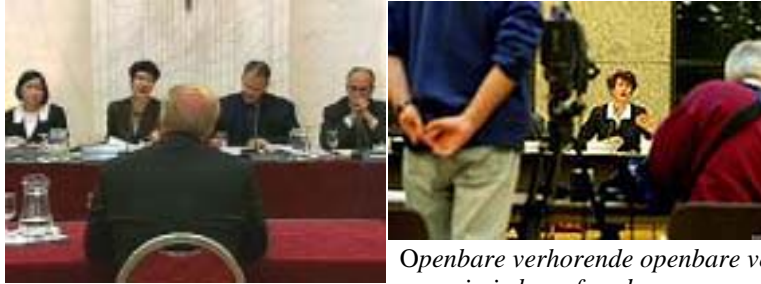
Openbare verhorende openbare verhoren v/d enquête commissie bouwfraude

En dan is het natuurlijk ook zo dat de bazen van de bouwbedrijven er financieel beter op zijn geworden, ook al moeten ze net zoals de rest van het volk in Nederland belasting betalen. Maar omdat de bazen van de bouwbedrijven zoveel verdiend hebben door deze bouwfraude gingen ze er nog heel erg dik op vooruit.