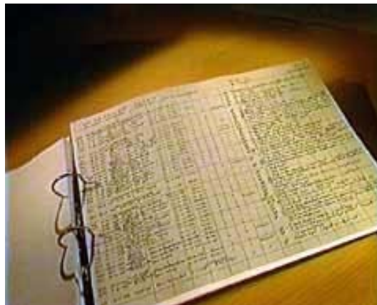
Bladzijde uit de schaduwboekhouding van het bedrijf Koop Tjuchem

Mijn hypothese is juist. Een schaduwboekhouding is inderdaad een boekhouding waar bestedingen instaan die achtergehouden zijn.