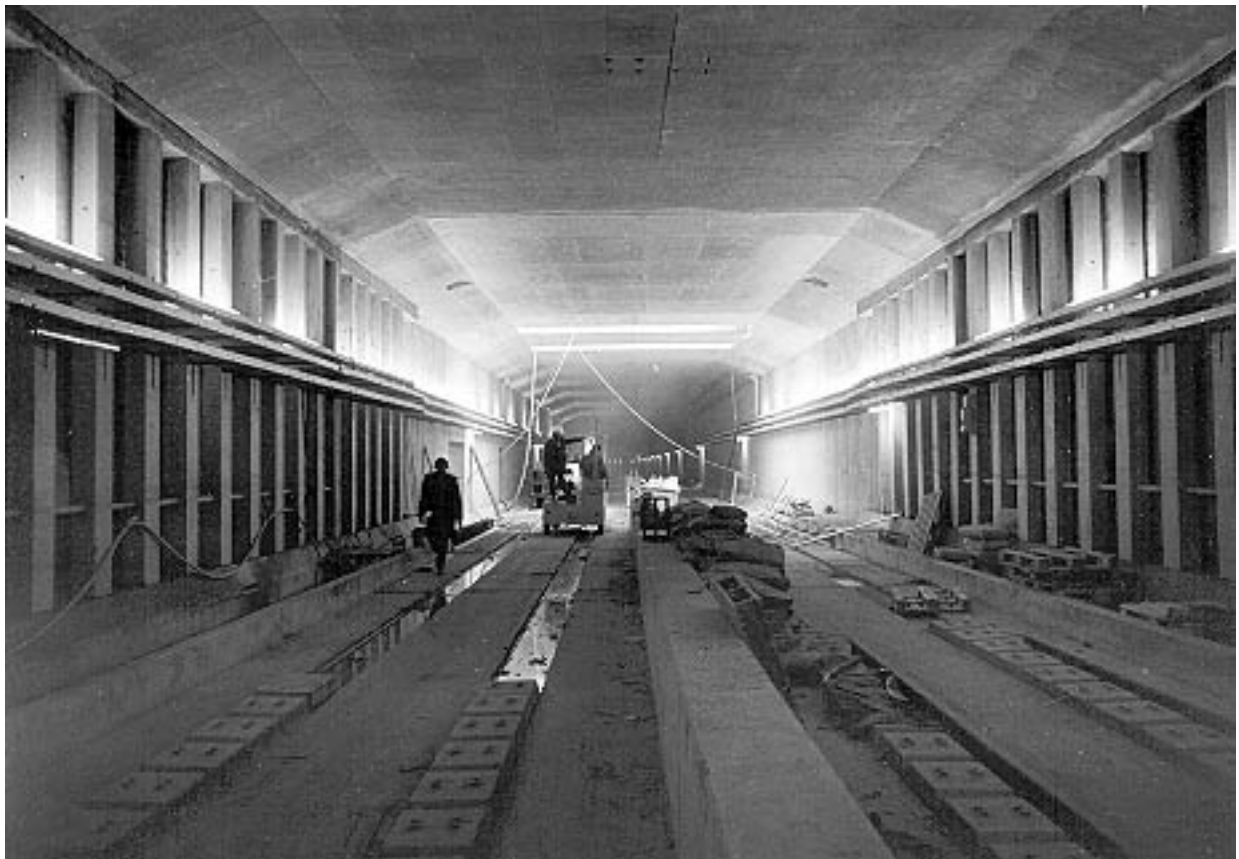
De Schipholtunnel tijdens de bouw